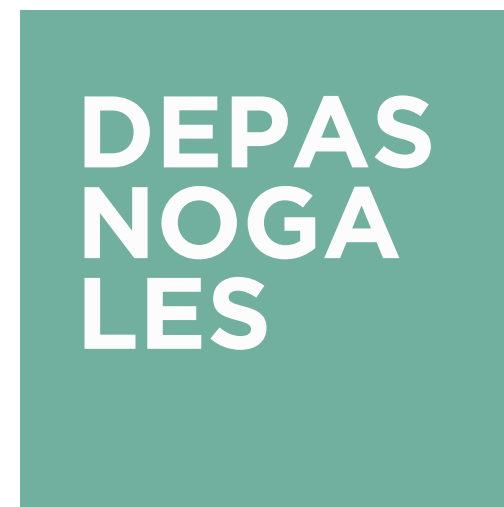
DEPARTAMENTOS LOS NOGALES | SAN ISIDRO

Departamentos de 3 dormitorios, de 180m 2 y 210m 2 .