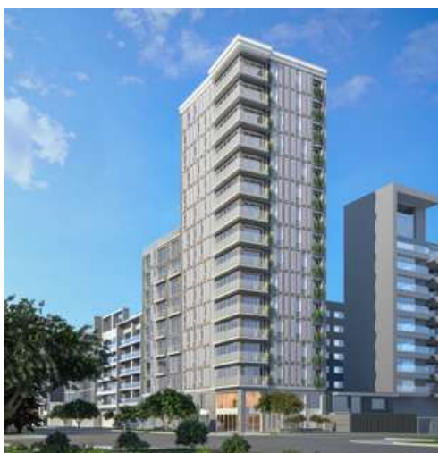
DEPARTAMENTOS EL SOL OESTE 405 | BARRANCO

Edificio de 2 cuerpos a una cuadra del malecón de Barranco. Departamentos de 3 dormitorios de 125m 2 y 200m 2 .